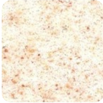
N 842 İnce