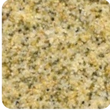
N 830 İnce