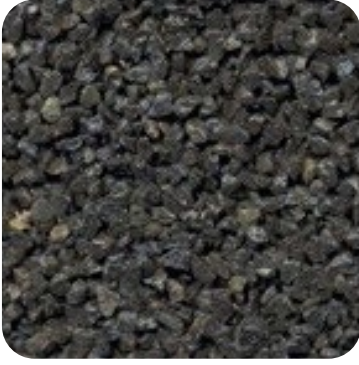
N 101 Kalın