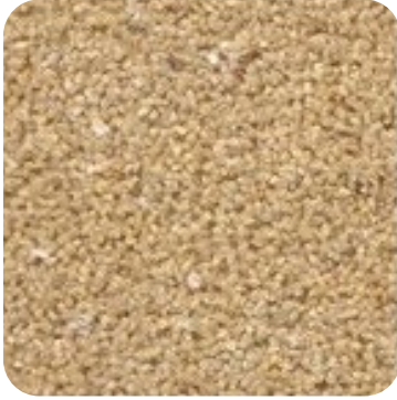
N 820 İnce