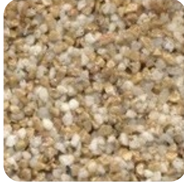
N 114 Kalın