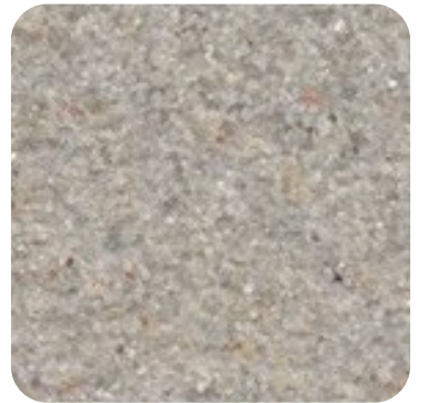
N 825 İnce