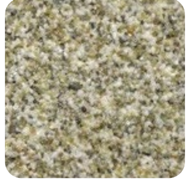
N 828 İnce