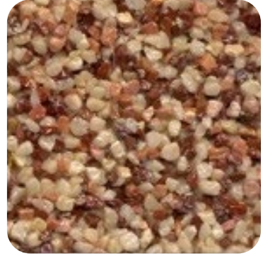
N 118 Kalın