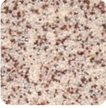
N 814 İnce