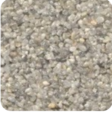
N 110 Kalın