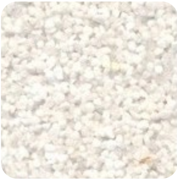
N 107 Kalın