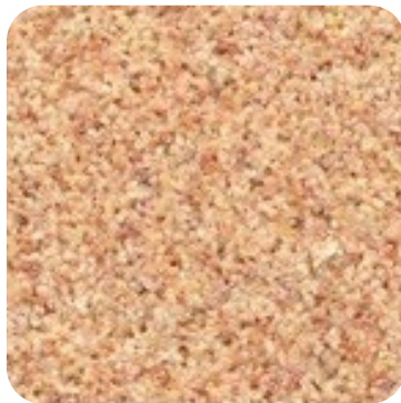
N 845 İnce