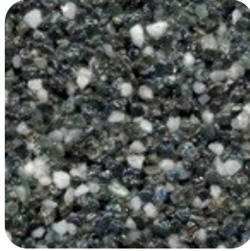
N 117 Kalın