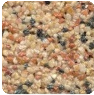
N 108 Kalın