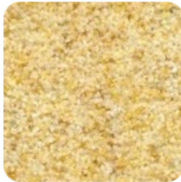
N 824 İnce