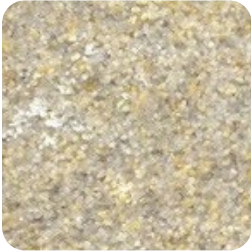
N 841 İnce