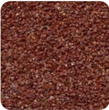
N 823 İnce