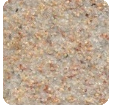
N 840 İnce