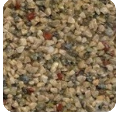
N 115 Kalın