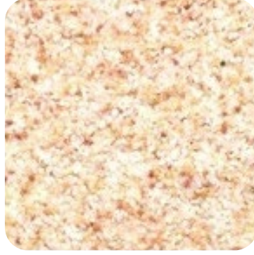
N 818 İnce