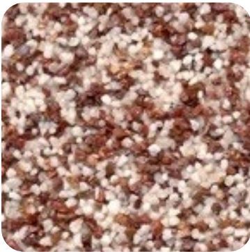
N 811 İnce