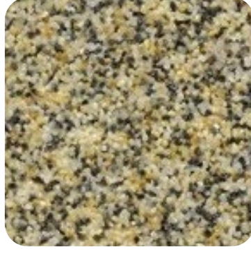
N 815 İnce