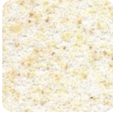
N 821 İnce