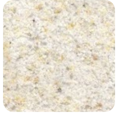
N 822 İnce