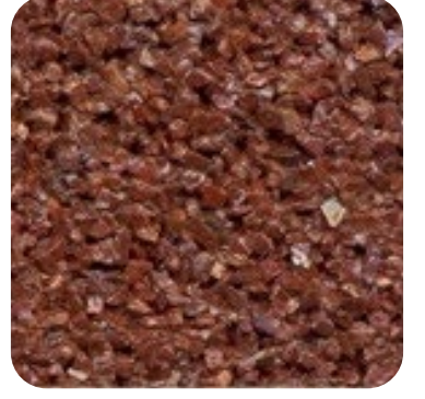
N 112 Kalın