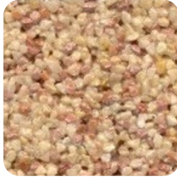
N 102 Kalın