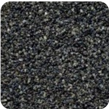
N 844 İnce