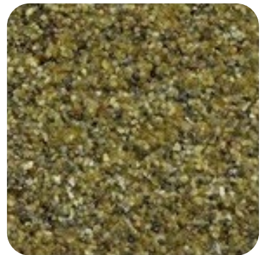
N 846 İnce