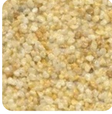
N 111 Kalın