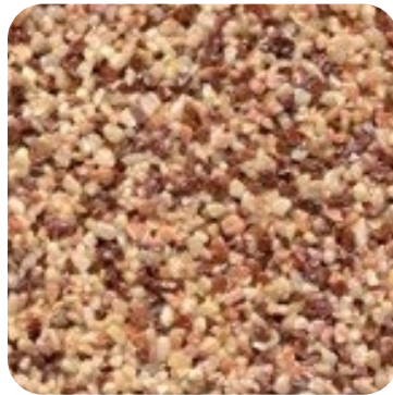
N 812 İnce