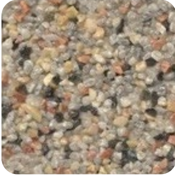
N 116 Kalın