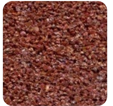
N 813 İnce