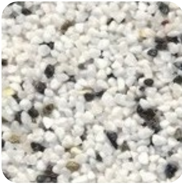
N 104 Kalın