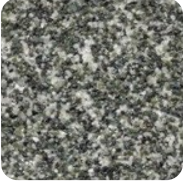
N 826 İnce