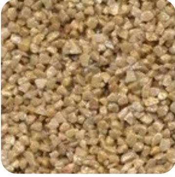
N 113 Kalın