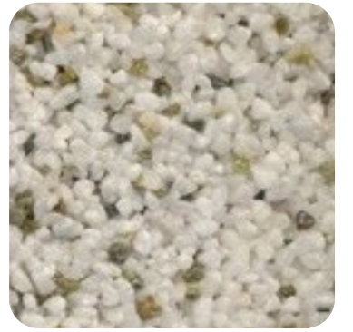
N 106 Kalın