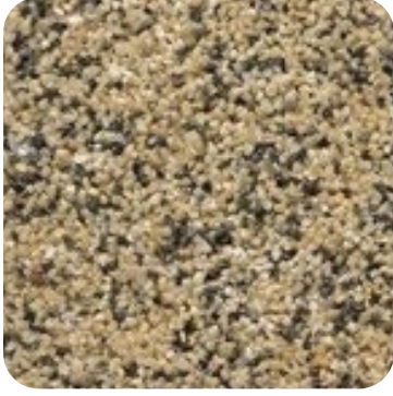
N 829 İnce