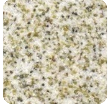
N 819 İnce