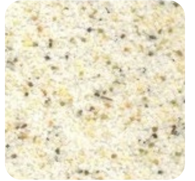
N 843 İnce