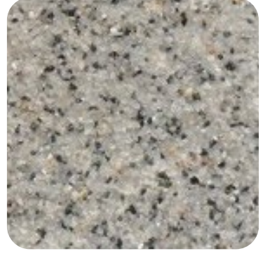
N 816 İnce