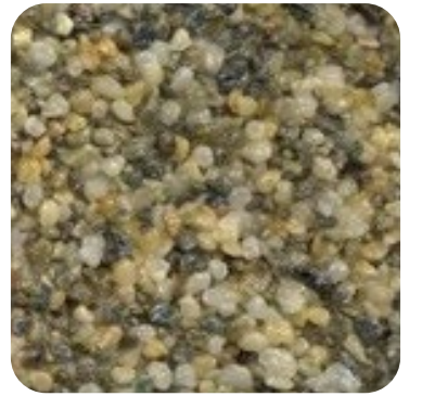
N 109 Kalın