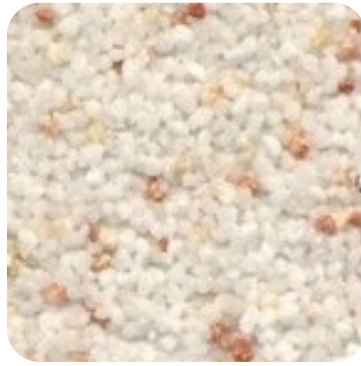
N 105 Kalın