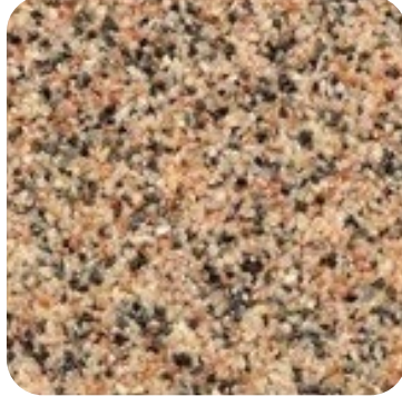
N 827 İnce