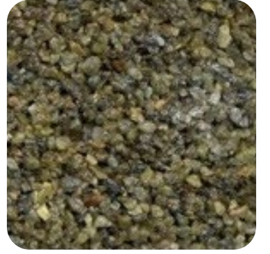
N 103 Kalın